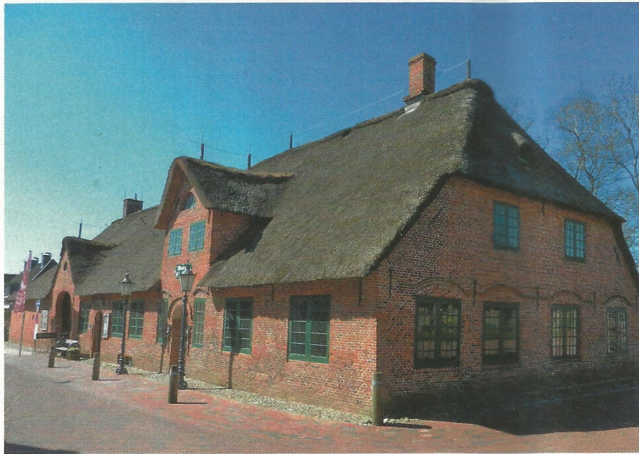
Das friesische Langhaus „Haus Jensen“ beherbergt das Museum seit 1951.